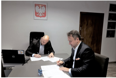
•Podpisanie umów

W 2021 r. dofinansowane zostanie 13 wniosków na łączną kwotę 51 826,50 zł. Komisja oceniająca dokonała przeglądu pieców i kotłów w terenie. Pozostałe 11 wniosków zostanie dofinansowane w 2022 r. na kwotę 52 000 zł. Cieszy fakt, że mieszkańcy czują potrzebę wymiany starych, nie-