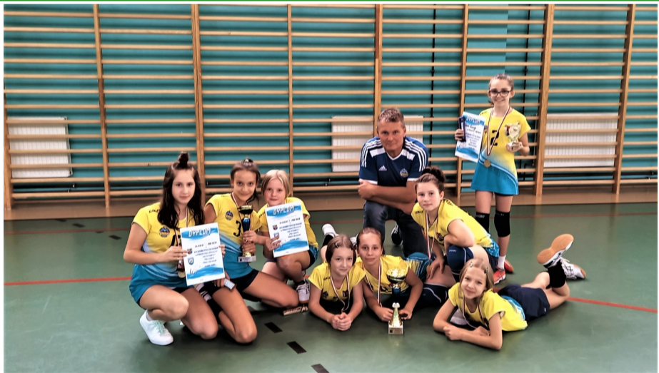
► Siatkarki po dekoracji medalowej

Dodatkową atrakcją był turniej jedynek przeznaczony dla zawodni-