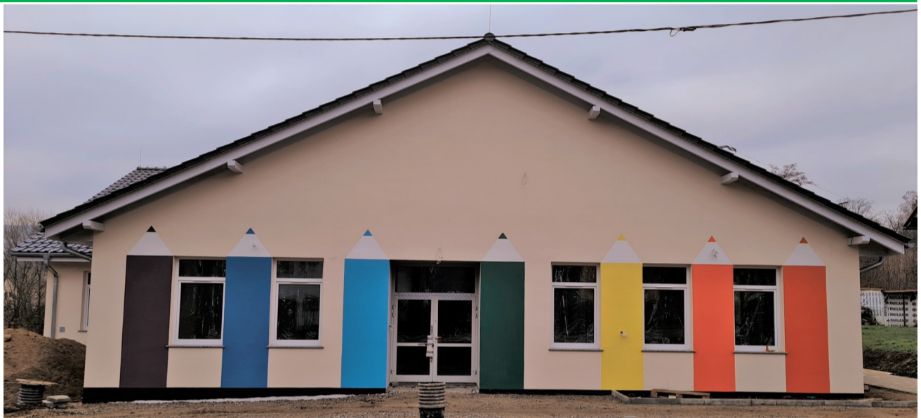
► Kolorowa elewacja

Braki na rynku materiałów budowlanych wpłynęły na tempo prac. W związku z tym, dopiero w lipcu zakończono pracę przy dachu. Wykonawca, aby za-