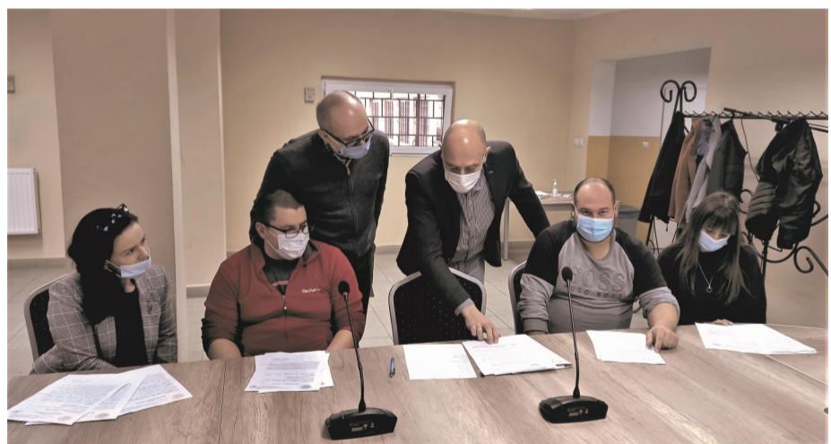
► Posiedzenie komisji

Pięciu wnioskodawców zgłosiło tę samą nazwę („Kolorowe Kredki”), 13 wnioskodawców zaproponowało inne nazwy, takie jak: Mały Europejczyk,