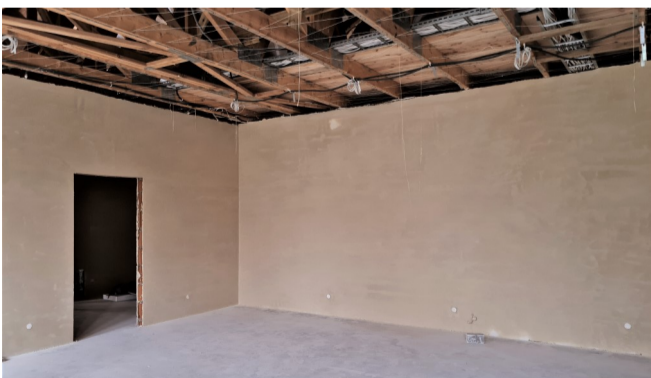
► Otynkowane ściany

Do wiosny na budowie gotowe były przyłącza sanitarne, izolacje termiczne fundamentów oraz podbu-