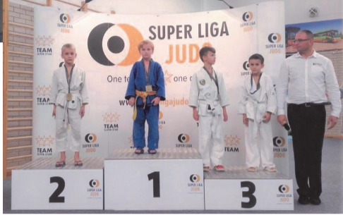
► Młodzi judocy

W sportowej rywalizacji udział wzięło ok. 700 zawodników, zarówno dzieci jak i młodzików, reprezentantów województwa dolnośląskiego oraz Czech. Julian w swojej kategorii wiekowej i wagowej stanął na najwyższym stop-