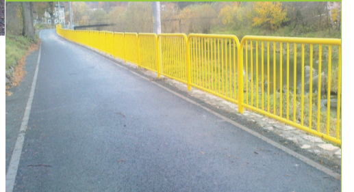
► Droga po remoncie

Dobiegł końca remont 500 - metrowego odcinka ul. Chłopskiej w Janowicach Wielkich. Polegał na położeniu nowej nawierzchni bitumicznej, budowie fragmentu muru oporowego oraz zainstalowaniu barierki zabezpieczającej skraj drogi.