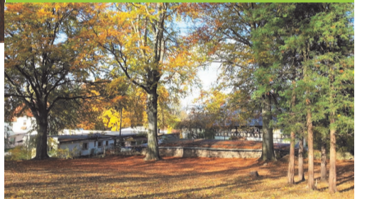
► Park jesienią

Ruszyły także prace mające na celu „odzyskanie” kolejnego rekreacyjnego miejsca. Uporządkowano i zainstalowano ławeczki w parku przy ul. 1 Maja w Janowicach Wielkich. Inicjatorem i autorem projektu była Grupa Odnowy Wsi, natomiast Urząd Gminy zajął się wykonywaniem prac. Jest to