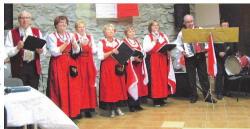
► Występ gospodarzy

•Karolina Rokicka / Stowarzyszenie i Zespół Bolczowianie