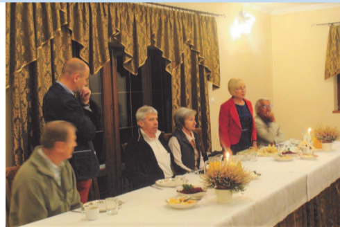
► Przemówienie gospodarzy

Po wspólnym posiłku młodzieży przedstawiono plan pobytu na najbliższe dni. Gościom zorganizowano: wycieczkę na Zamek Bolczów, gry i zabawy oraz ognisko na terenie Parku „Zielona Dolina”, dyskotekę w obiek-