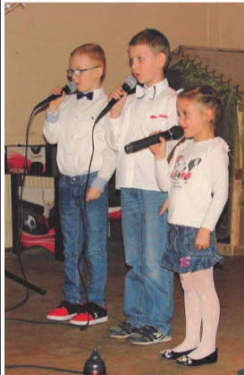
► Mali artyści

Uroczystość rozpoczęła odśpiewaniem hymnu Polski przez wszystkich zgromadzonych. Młodzież recytowała wiersze i śpiewała patriotyczne utwory. Następnie na scenie pojawił się zespół Bolczowianie, uświetniając wydarzenie występem wokalnym, a także przedstawiając historię obchodzonego święta.