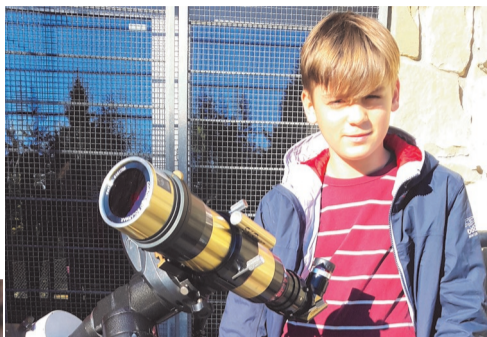
► „zDolny Śląsk”

Z początkiem listopada Kapituła Dolnośląskiej Rady Wspierania Uzdolnień przyznała 56 stypendiów w XVI edycji Programu Stypendialnego „zDolny Śląsk” za rok szkolny