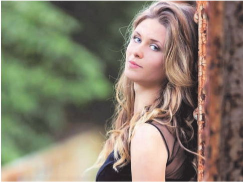
► Stypendystka „Agrafka Agory”

Celami Programu Stypendialnego dla Studentów „Agrafka Agory” są: wspieranie studentów szczególnie uzdolnionych i znajdujących się w trudniejszej