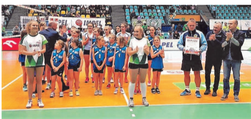
► Janowickie siatkarki