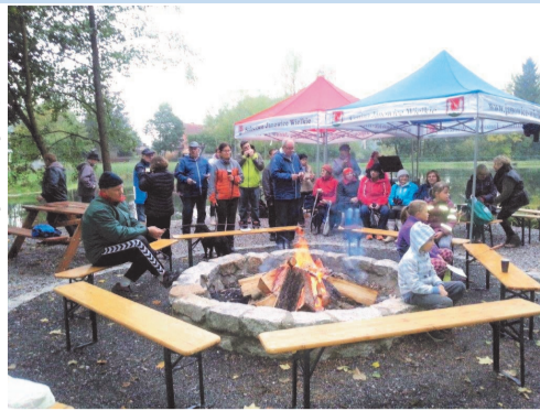
► Wspólne ognisko

Odnowy Wsi wyspa odzyskała swój blask i cieszy zarówno mieszkańców, jak i turystów.