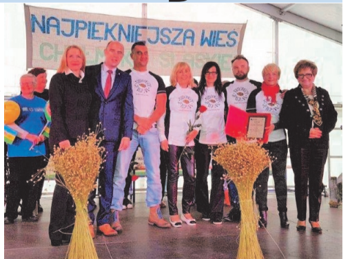
► Gala wręczenia nagród zakup dodatkowej lampy doświetlającej na wyspę.